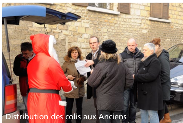
Distribution des colis aux Anciens

Cette année encore, les zygomatiques ont été grandement sollicités grâce à la performance de la troupe théâtrale de Verneuil-en-Halatte dans une comédie de J.C Islert, Délit de fuites. Ce spectacle, proposé par la Maison Pour Tous, s'est déroulé à la Salle des fêtes le samedi 14 Décembre. Prenez date dès à présent de leur prochaine prestation : il s'agira du samedi 13 Décembre 2014. Venez nombreux pour un bon moment de détente ! BF