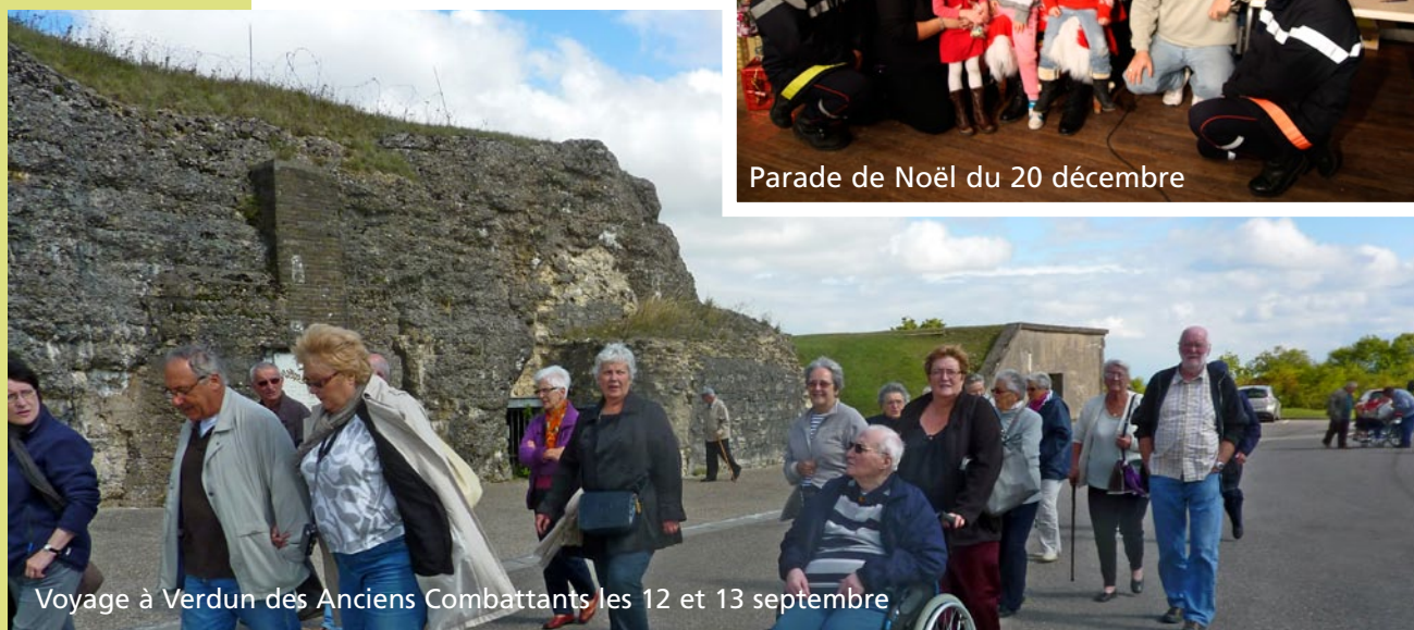
Voyage à Verdun des Anciens Combattants les 12 et 13 septembre