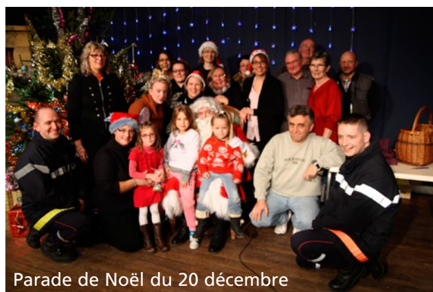
Parade de Noël du 20 décembre