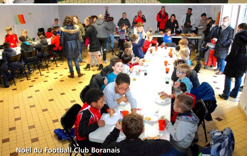
Noël du Football Club Boranais