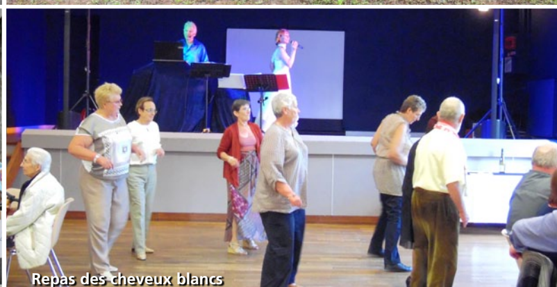
Repas des cheveux blancs