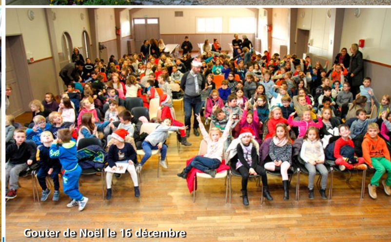
Gouter de Noël le 16 décembre