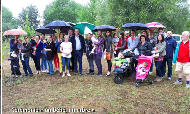
Cérémonie « un bébé, un arbre »