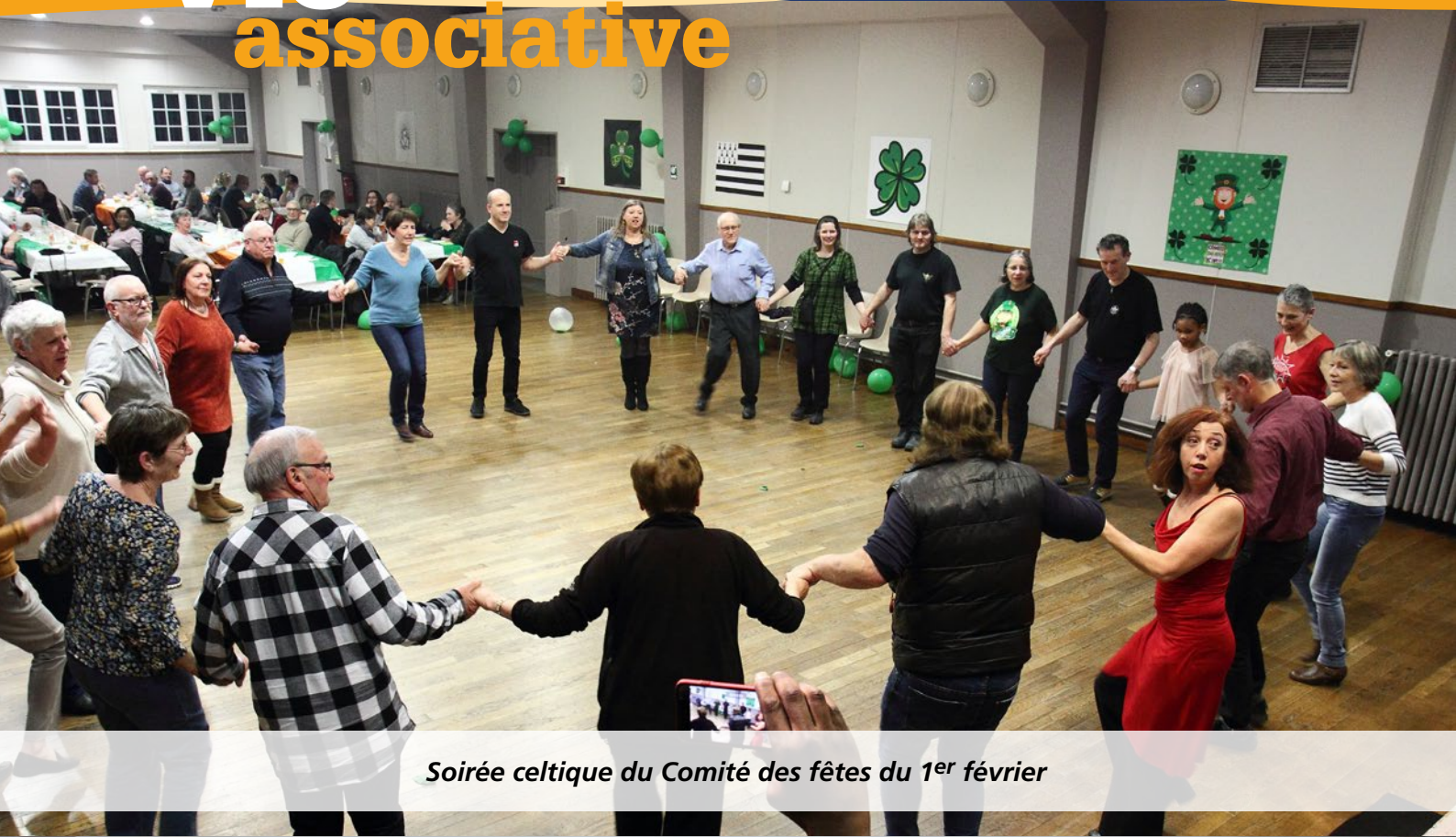
Soirée celtique du Comité des fêtes du 1 er février