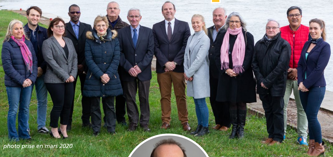
photo prise en mars 2020