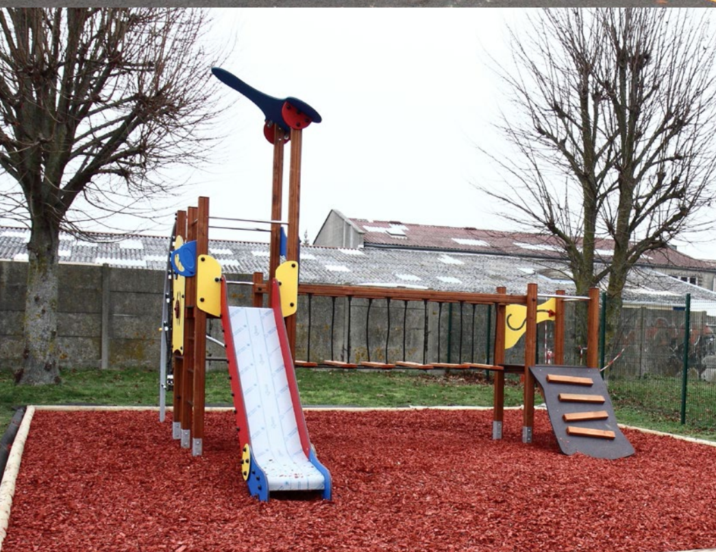
Installation d'une structure de jeux dans l'enceinte du stade municipal.