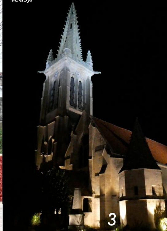
Réfection de l'éclairage de l'église : mise en valeur du patrimoine local et économies d'énergie (passage aux leds).