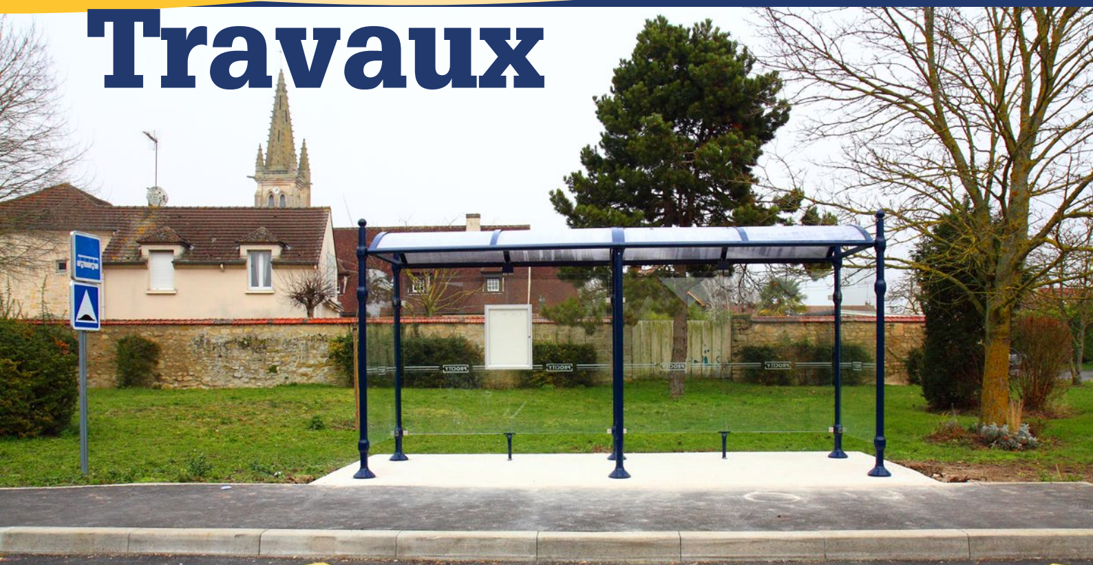
Parking de l'Enclos : aménagement d'un abribus aux normes Personnes à Mobilité Réduite, mise en sécurité du carrefour avec un passage surélevé.