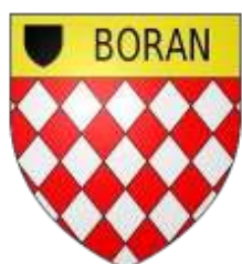
Arrondissement de Senlis Canton de Chantilly