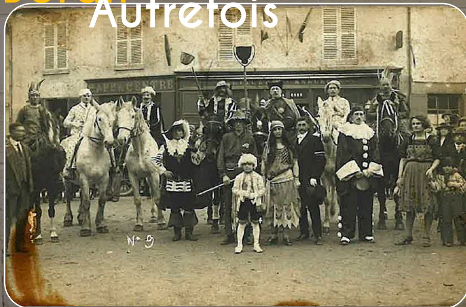
Ancienne carte postale de notre village.